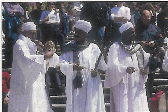
3) Giuseppe Di Stefano